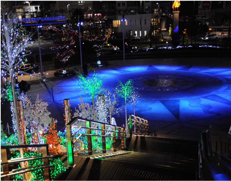
イルミネーション / JR岐阜駅 岐阜市の玄関として相応しい美しさだと思います。特に冬はキレイ。