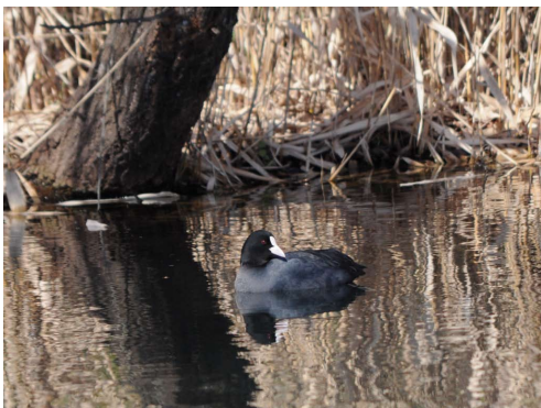
オオバン / 河川環境楽園