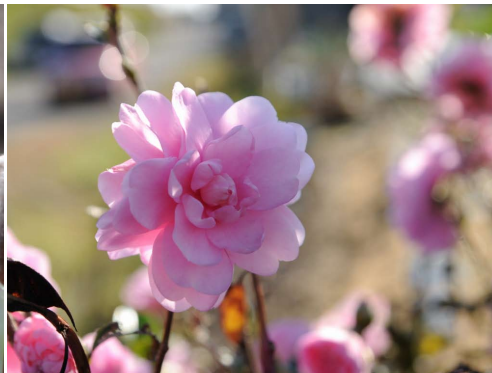
淡いピンクが優しいね / 岐阜市領下