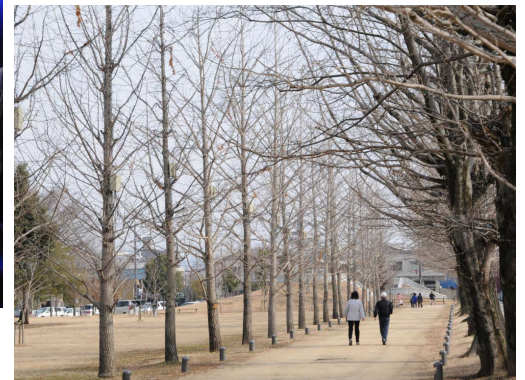
冬枯れの並木道 / 各務原冬ソナストリート