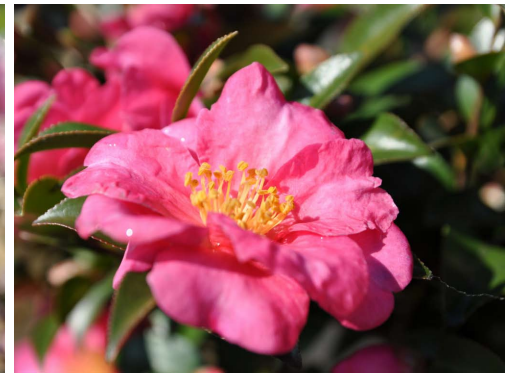
サザンカ / 岐阜市長森