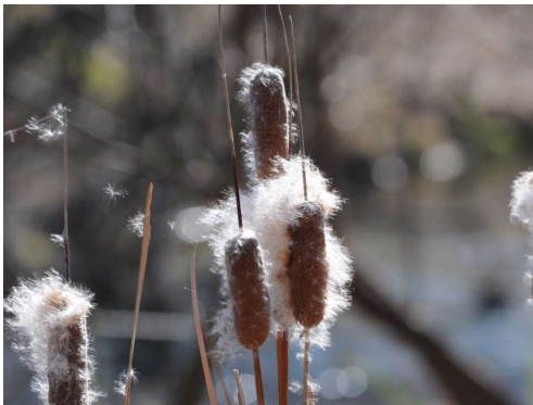
ガマの穂から種の旅立 / 河川環境楽園