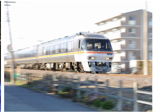
ワイドビューみだ / 岐阜市領下