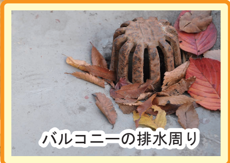
バルコニーの排水周り