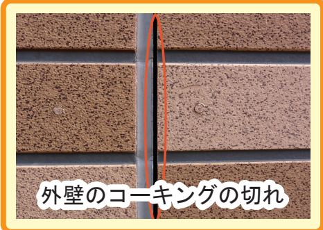
外壁のコーキングの切れ